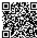
外食訂購實施要點